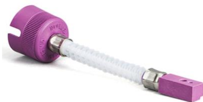
Isoflurane key filler bottle adaptor

Παρακάτω βλέπετε τον προσαρμογέα (key filler) πλήρωσης του εξαερωτήρα. Ειδικό εξάρτημα ασφαλείας, με κωδικοποίηση χρώματος ανάλογα με τον αναισθητικό παράγοντα προς αποφυγή της οποιαδήποτε πιθανότητας λάθους. Για χρήση ισοφλουρανίου, χρησιμοποιείται ο μωβ προσαρμογέας της φωτογραφίας. Σε περίπτωση χρήσης σεβοφλουρανίου, θα πρέπει να γίνει βαθμονόμηση του εξαερωτήρα και να χρησιμοποιηθεί άλλος προσαρμογέας (key filler) για την πλήρωση του εξαερωτήρα, ο οποίος θα έχει κίτρινο χρώμα.