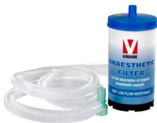
Φίλτρο ενεργού άνθρακα

Induction chamber (κλωβός αναισθησίας). Διατίθεται σε δύο μεγέθη 1,5 λίτρου (19x14x10cm) και 5,25 λίτρων (28x14.5x18cm). Ο χρήστης επιλέγει το μέγεθος που επιθυμεί.