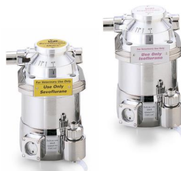
Εξαρωτήρες ισοφλουρανίου ή σεβοφλουρανίου