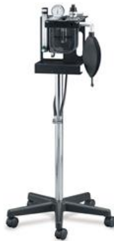
Matrix™ VME2 Small Animal Anesthesia