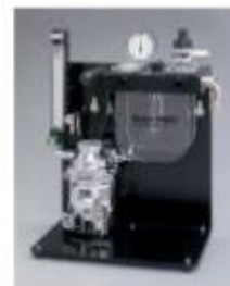
VME Tabletop 14" H x 13.5" W x 8.5" D