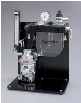
Matrix™ VME2 Wall mount Small Animal Anesthesia

Διατίθενται τροχήλατες, επιτραπέζιες κι επίτοιχες αναισθητικές μηχανές. Είναι βέβαιο ότι κάποιο μοντέλο Matrix™ καλύπτει πλήρως της ανάγκες της κτηνιατρικής κλινικής σας.