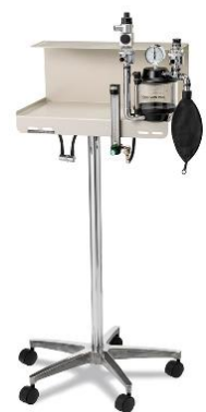
Matrix™ VMS Plus™