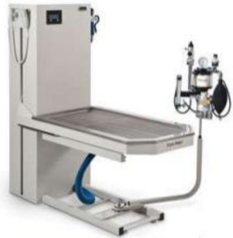
VMS mounted on a Caris Major Wet Table